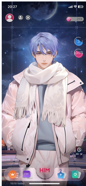
어플리케이션 화면(Android APK)